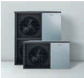
Außeneinheiten im modernen, zeitlosen Design, aus eigener Entwicklung und Herstellung – Made in Germany.

Beruhigt zurücklehnen: Die Wärmepumpenanlage ist per Smartphone steuerbar und auf Wunsch per Internet mit dem Kundendienst verbunden.