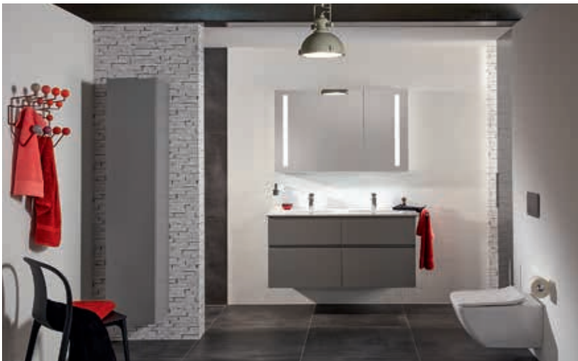
Verity von Meisterbad: geradliniges Design in europäischer Spitzenqualität

Hobbyplaner und Wellnessprofis. 65 der besten Installationsbetriebe Österreichs haben nach einem Weg gesucht, wie sich das Kundenbedürfnis nach Online-Shopping mit den speziellen Erfordernissen der Badezimmgestaltung vereinen lässt, und daraus die Marke Meisterbad entwickelt. Wer www.meisterbad.at öffnet, wird zu allererst einmal von schönen Badfotos inspiriert. Man findet Tipps zu wichtigen Themen wie Renovierung, barrierefreie Gestaltung oder auch zu praktischen Accessoires. Eine intuitiv zu bedienende Planungs-App lädt jeden dazu ein,